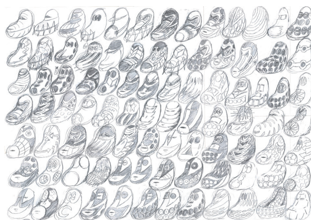
「ふれてみよ② <ミロ変顔>のためのドローイング(2)」2014 ©Yuichi Yokoyama, Courtesy of ARATANIURANO