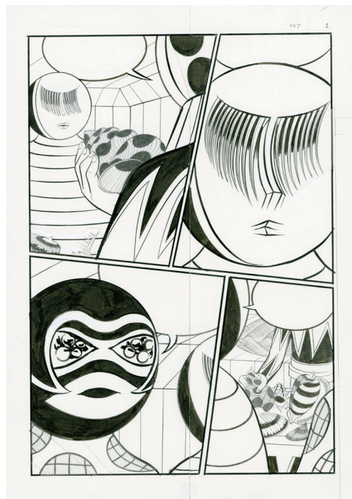
「ロワ-p1」2014 ©Yuichi Yokoyama, Courtesy of ARATANIURANO