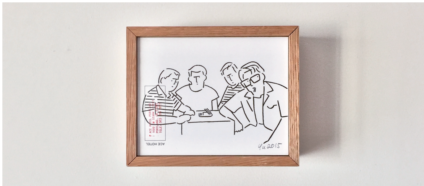
stand by me © yu nagaba