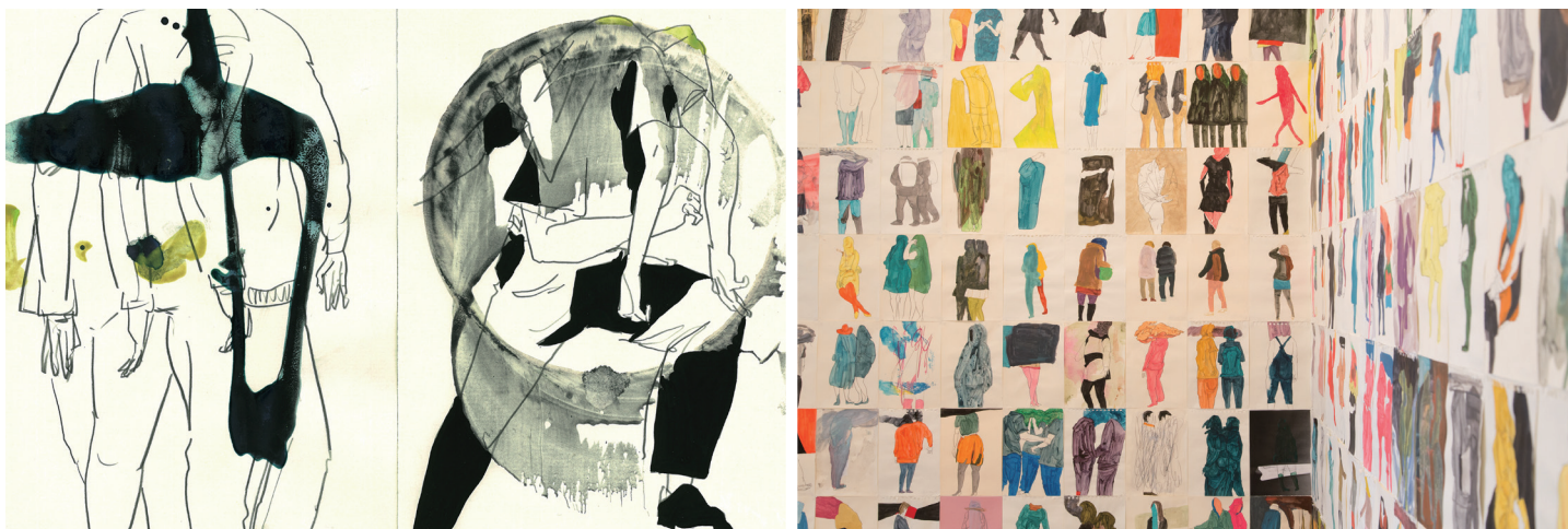
all or nothing or dancing © jun nakagawa